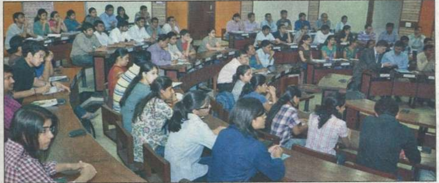
Students all ears at a workshop on open data development initiative of the World Bank on Tuesday

Malhotra gave an overview of the bank's modernization agenda and discussed the relevance of open development and open data tools in the con-