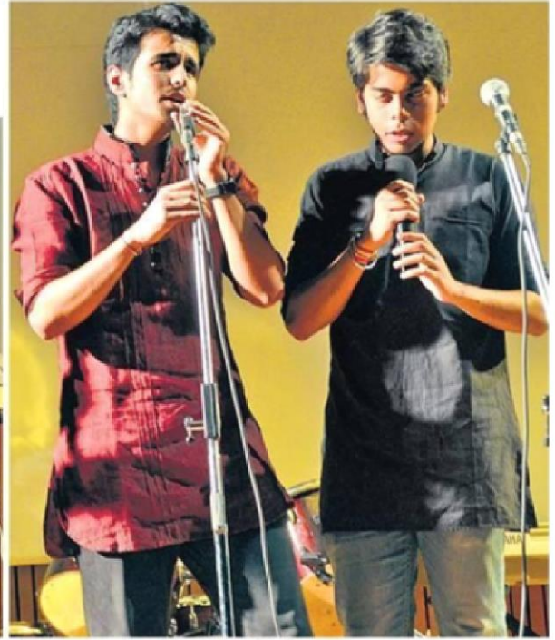
कुछ स्टूडेंट्स ने 'ए कैपेला' की प्रस्तुति दी।