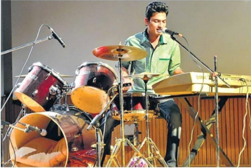
ड्रम, की बोर्ड और वोकल्स पर एक ही आर्टिस्ट ने परफॉर्म किया।

रंगों के पर्व पर शहर में विभिन्न स्थानों पर कला के अलग-अलग रंगों से होली खेली गई। कहीं संगीत और नाट्य मंचन तो कहीं हास्य-व्यंग्य की फुहारों से श्रोताओं को मीगोया। अवासेन क्लब के फागोत्सव में बरसाने की लट्टमार होली का सजीव चित्रण किया गया।