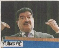
डॉ. बीआर शेटी

अधिकांश लोग मानते हैं कि बिना पैसे के बिजनेस नहीं होता, लेकिन मैंने बिना पैसे के 11 बिलियन डॉलर की एक कंपनी खड़ी कर दी, लेकिन पैसे को कभी अपने ऊपर हावी नहीं होने दिया। आप कोई भी काम पैसा कमाने के बजाय समाज के लिए कुछ करने के उद्देश्य से करें, पैसा तो अपने आप ही आ जाएगा। जिंदगी ईसीजी की तरह होनी चाहिए अप्स एंड डाउन। जिंदगी हमेशा एक जैसी रहने से इसका मजा खत्म हो जाता है।