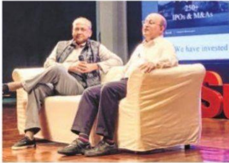
OUR STAFF REPORTER Indore