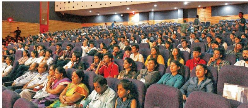
आईआईएम और आईआईटी के संयुक्त तत्वावधान में हुए आई-5 समिट के दूसरे दिन रविवार को बड़ी संख्या में स्टूडेंट्स ने हिस्सा लिया।