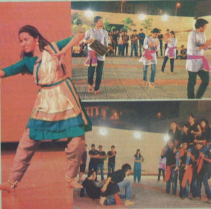
Various cultural & sporting events held during IIT-IIM Face Off on Saturday.

Highlight of the evening was Photography Exhibition. Photon, the photography club at IIM Indore, came up with an interesting initiative. There is a rather weak culture of portraying one's talent in photography