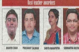
Best teacher awardees