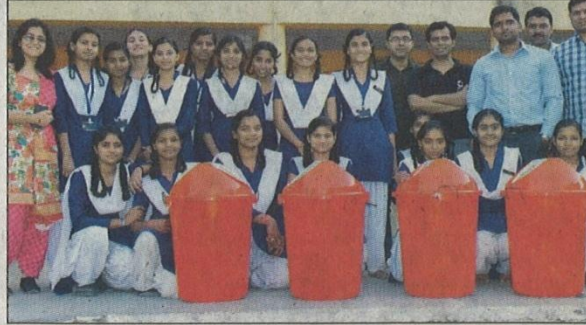
IIM-Indore organized a sanitation and hygiene awareness programme at Government Girls Higher Secondary School, Rau on Tuesday