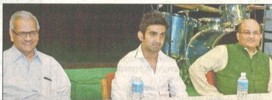
Cricketer Gautam Gambhir at IIM in Indore on Sunday with top brass of IIM. (Right) Participants and students pose during the fest

Addressing the students, Gambhir said, "As kids we take care of our school bags; as teenagers we learn about time management and as grown-ups we learn about social responsibilities. Some of us are macromanagers while some