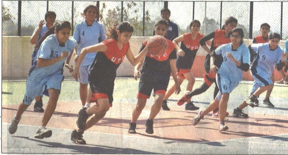
Students during the first day of Ranbhoomi fest