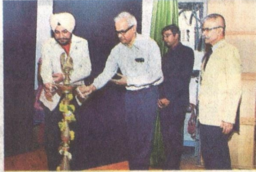
● इंदौर । दीप प्रज्ज्वलित कर किया शुभारंभ