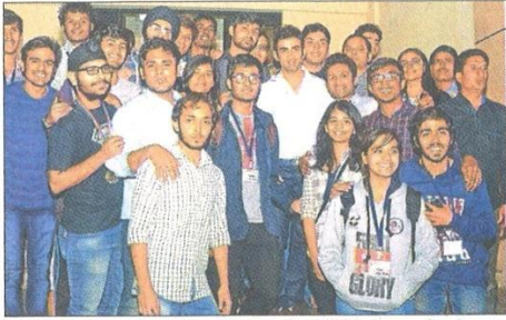
■ Cricketer Gautam Gambhir with students at IIM-Indore on Sunday.