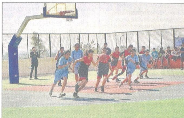
■ Students competing in a basketball match on the opening day of 3-day annual sports fest Ranbhoomi at IIM-Indore on Friday.

In his address he urged the students to play with full dedication, loyalty and ethics.